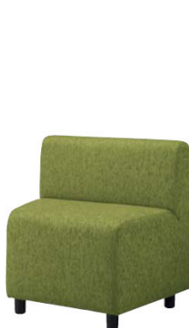
35LC-11F グラスグリーン 樹脂脚