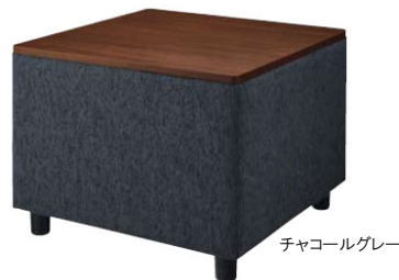
チャコールグレー