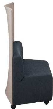
35LC-11FP-C ソファ:チャコールグレー キャスター脚