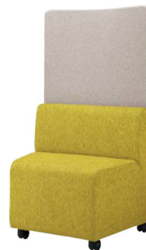
35LC-11FP-C ソファ:ミモザ キャスター脚