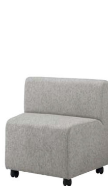
35LC-11F-C ライトグレー キャスター脚