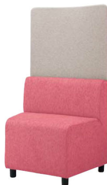
35LC-11FP ソファ:ピンク 樹脂脚