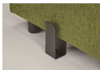
オプション: 連結金具 ¥5,000(税抜)

※ウォールナット色は、手脂などの汚れが目立ちにくい メラミン化粧板を使用しています。