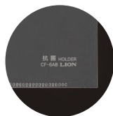
シート本体の「抗菌」表示

抗菌剤を配合した再生PPシート製のクリアーホルダーです。抗菌仕様であることが一目でわかるように「抗菌」の文字が入っており、受け取る側の安心感にも繋がります。10冊パックと、お得な50冊パックをラインアップ。再生材を使用し、グリーン購入法に適合しています。