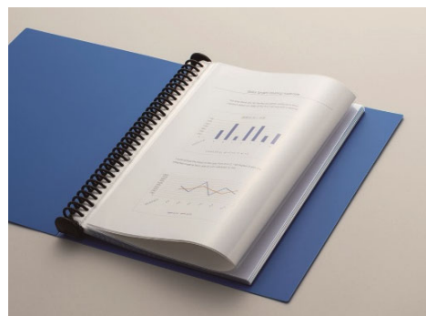
CL-303F (折りたたんだところ)