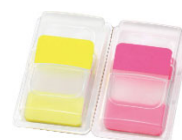
ポップアップ式ケースタイプ