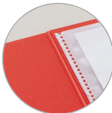
溶着部分の拡大図

10ポケットタイプは、裏表紙にポケットが溶着されているスリムな設計です。背幅が4mmの薄型なのでコンパクトに書類を収容でき、バッグの中に入れてもかさばりません。