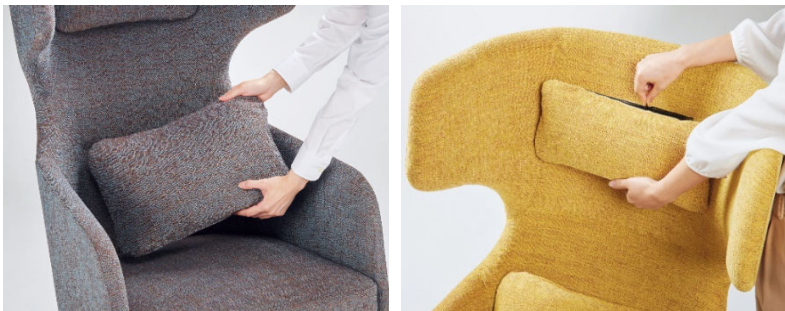
置き型クッション