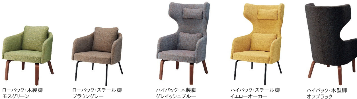
ローバック・木製脚 モスグリーン