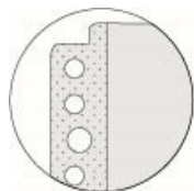
とじ穴部のコーナーカット

クリアーホルダーと同様に、表面にはエンボス加工は施さずに透明度を高め、バイオマス素材を10%配合したクリアーポケット(バインダー追加用)です。とじ穴部は5枚重ねに補強し、耐久性を高めました。また、とじ穴部の上下は角をカットしてあるため、A4サイズより大きいバインダーでもとじ具に干渉せず収容可能です。