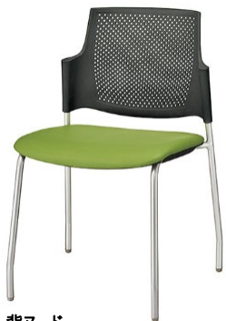
背ヌード レザー張り: グリーン/シェル: ブラック ¥23,100(税抜)