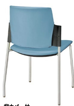
背カバー付 レザー張り: ライトブルー/シェル: ブラック ¥28,800(税抜)