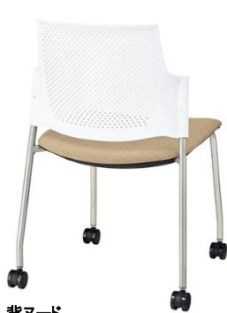
背ヌード 布張り: ベージュ/シェル: ホワイト ¥25,000(税抜)