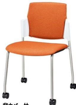
背カバー付 布張り: オレンジ/シェル: ホワイト ¥30,800(税抜)