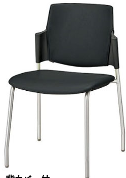
背カバー付 レザー張り: ブラック/シェル: ブラック ¥28,800(税抜)