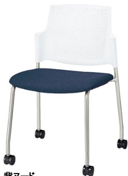
背ヌード 布張り: ネイビー/シェル: ホワイト ¥25,000(税抜)