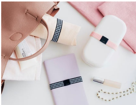
お弁当箱や手帳に

ゴムバンドは、全長60cmでA4サイズを縦に留められる長さです。ご家庭にあるはさみで簡単にカットでき、留め具は2個入りですので、1セットで2つのバンドを作ることができます。