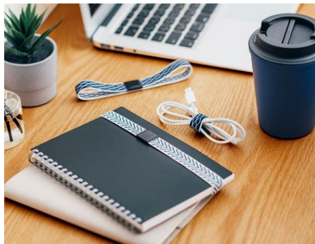
ノートや充電ケーブルに