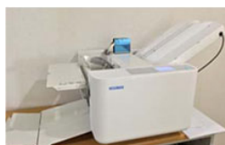
通常は紙折機として使用

また、オプションのミシン目ユニットを導入した事で、領収書の「ミシン目加工」や「裁断加工」も自動化する事ができ、作業性が改善して「働き方改革」につながりました。