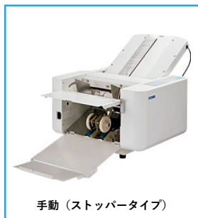
手動（ストッパータイプ）