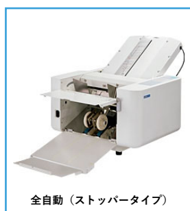
全自動（ストッパータイプ）