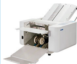
全自動（ストッパータイプ）