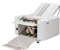
全自動（ストッパータイプ）