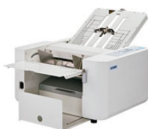
手動(ストッパータイプ)