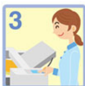
後はスタートボタンを 押すだけ。