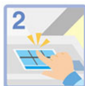
タッチパネルで 折り方を選ぶ。