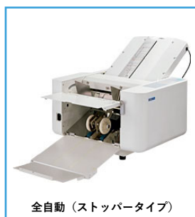
全自動 (ストッパータイプ)