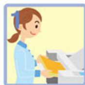
用紙をセットする。

これまで使っていた紙折機よりも処理速度が速く、折り作業が効率的に行えるようになりました。また、消耗品の交換が簡単に行え、折りローラー2本も工具を使わずに外せるので、メンテナンスがスムーズに行えて扱いやすい紙折機です。