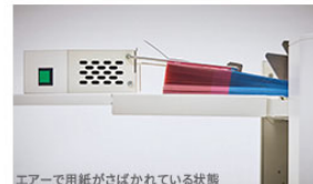
エアーで用紙がさばかれている状態