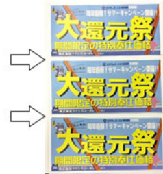
ミシン目ユニット(切れ目カッター)使用により裁断が可能！