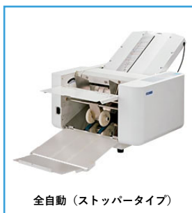
全自動（ストッパータイプ）