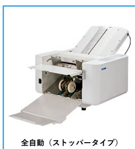
全自動（ストッパータイプ）